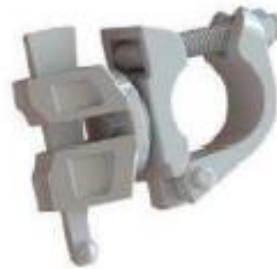
End and Coupler