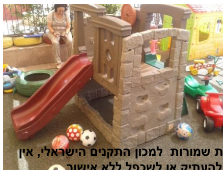
כל הזכויות שמורות למכון התקנים הישראלי, אין להעתיק או לשכפל ללא אישור