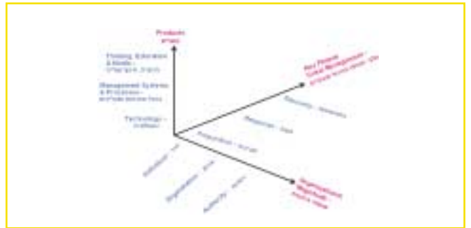
איור 2: העמדה הישראלית להיקף מרחב הפעילות של ISO/TC 223

כדי ליצור עניין ומומנטום, חיוני לעסוק בפעילות תקינה שתעורר עניין ותעודד פעילות מסחרית במגזר הפרטי (יועצים ויצרנים).